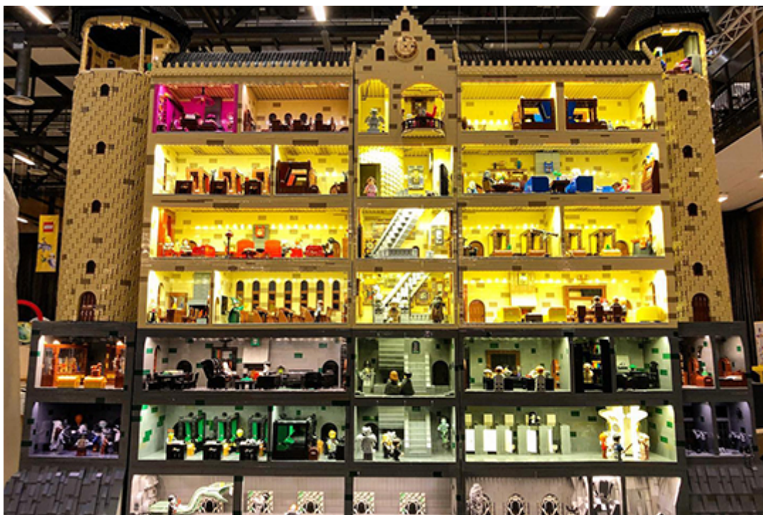
Förra årets bygge av Hogwarts var stort, men i år är det ännu större.