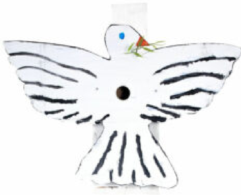
Löa friskolas finalbidrag "Fredsduvan".

Av totalt 750 inskickade bidrag har juryn nu utsett årets 15 finalister, och bland dessa har - för tredje året i rad - ett bidrag från Löa friskola tagit en finalplats. Med fantasi och finurlighet har de skapat bidraget "Fredsduvan".