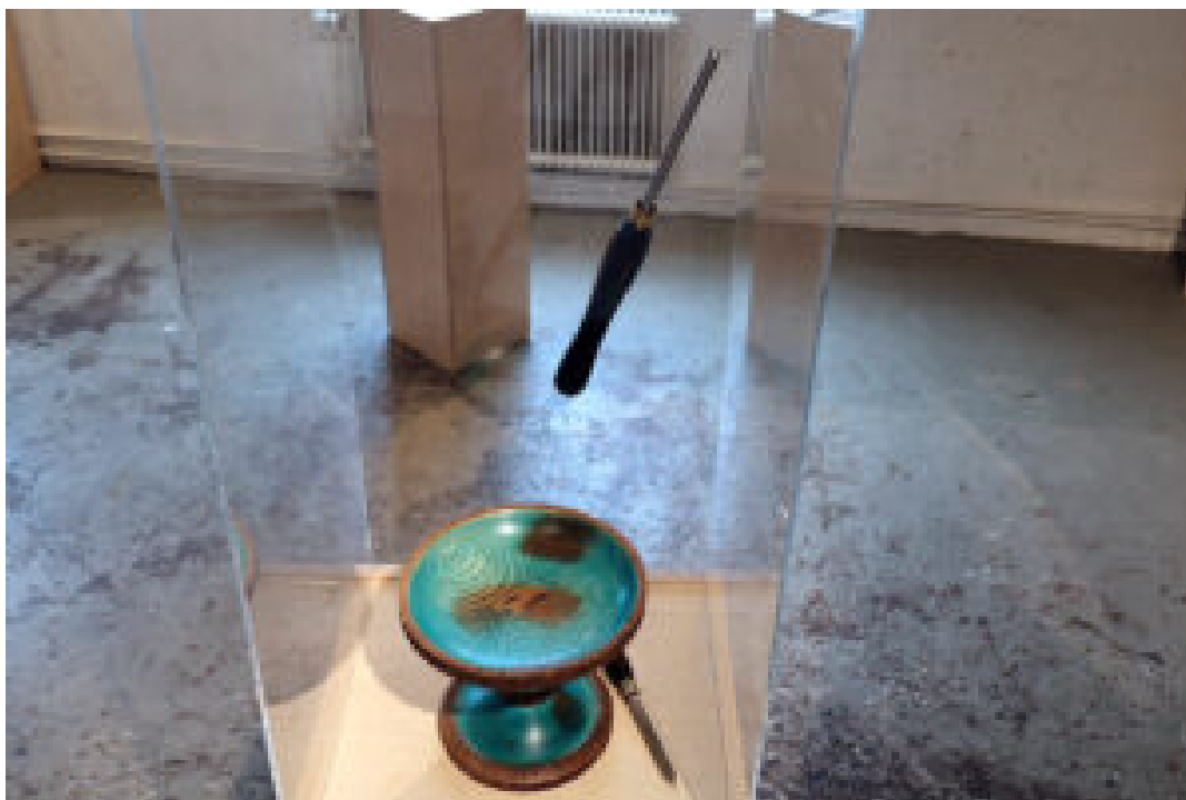
Deco Archipelago.

Christopher Warwick-Fishers verk Deco Archipelago är ett fruktfat på fot inspirerat av Art Deco och naturens former, med snidade texturer och färger i turkos och bränt orange. Han arbetar med verktyg från Henry Taylor Tools, den historiska Sheffield-tillverkaren som smider professionella eggverktyg för hand sedan 1834.